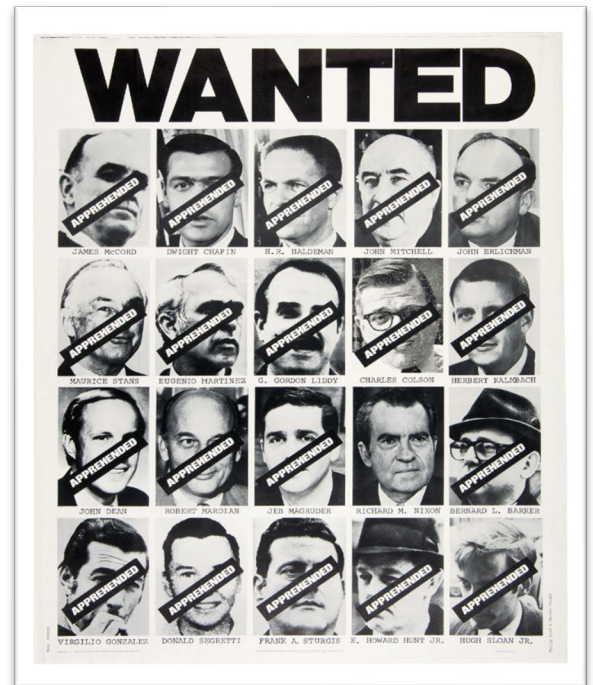
Wanted poster of Watergate conspirators

Although President Nixon initially said that White House aides would not be permitted to testify due to executive privilege , the committee pushed back, arguing that executive privilege did not apply to information about alleged crimes. The president ultimately did not prevent his aides from testifying.